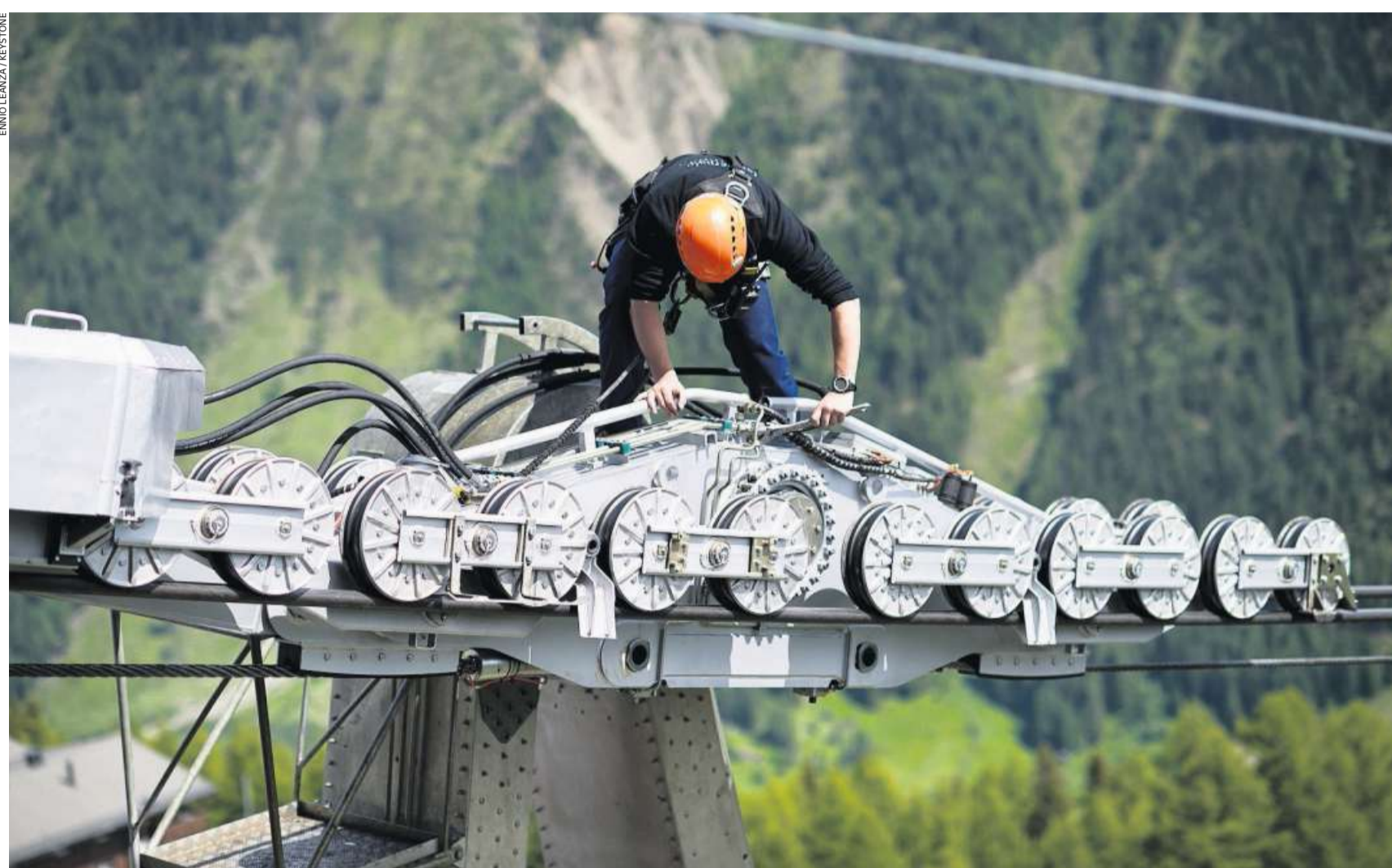
Seilbahn-Mechatroniker an der Arbeit: Seine Lehre erfordert hohe mathematische und naturwissenschaftliche Fertigkeiten. (Goppenstein, 14. Juni 2012)

Die Profile der Berufe sind im Internet unter www.anforderungsprofile.ch aufgeschaltet. Eine Rangliste gibt es dort nicht, weil man keine Branche vor den Kopf stossen will: «In jedem Beruf gibt es gewisse Fähigkeiten, die besonders wichtig sind», sagt Walter Goetze, Leiter des Büros für Bildungsfragen. Das nun vorliegende Ranking bezieht sich hingegen auf den Mittelwert. Auch ein vermeintlich einfacher Beruf kann in einem Bereich ziemlich hohe Anforderungen stellen. So muss etwa eine Coiffeuse über gute sprachliche Fähigkeiten verfügen, und der Recyclist braucht naturwissenschaftliche Kompetenzen. Selbst der letztplazierte Automatikmonteur und der top-